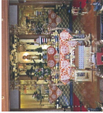
※昨年の報恩講の荘厳です。浄土真宗のお寺にとっても、最も大切な法要ですので、最高の荘厳になります。