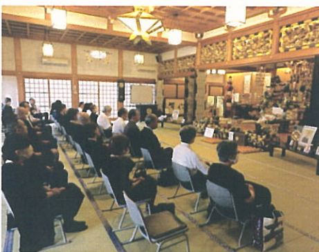
【新盆合同法要の様子】

本年8月13日のお盆の入り、本堂にて新盆合同法要を勤修しました。今回、初の試みでしたが、11組30名を超える方々の参加があり、無事に終えることが出来ました。手前の机に思い思いの写真や位牌をお飾りし、新たにお盆を迎えられた方々と共に、仏様となられた故人に思いを馳せながら誦経し、お盆の由来等のお話をさせて頂きました。「気軽に参加出来て良かった」といった感想を頂きました。来年も、通常通り、個別の新盆法要（ご自宅・本堂共に）をお受けすると共に、合同法要も行いたいと思っております。